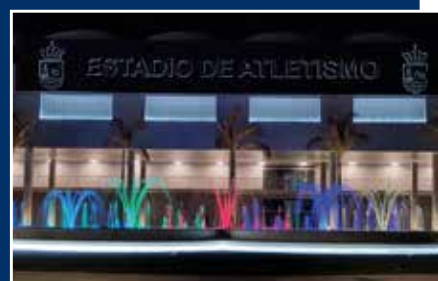
Depósito Estadio de Atletismo.